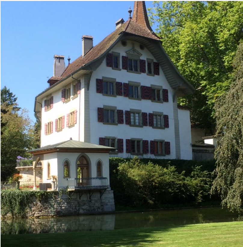
Schloss Landshut, Utzenstorf, BE

Schweizer Museum für Wild und Jagd. Wechselnde Sonderausstellungen Erwähnenswert ist auch der Besuch der Schweizer Wildstation und Vogelpflegstation etwas rechts vor dem Haupteingangstor.