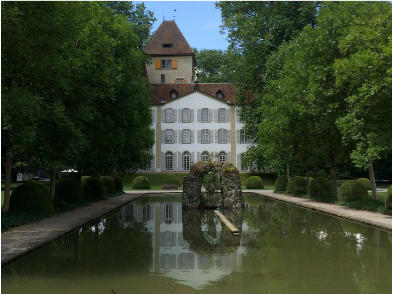
Schloss Jegenstorf, BE

Schöner Park, Museum für bernische Wohnkultur.