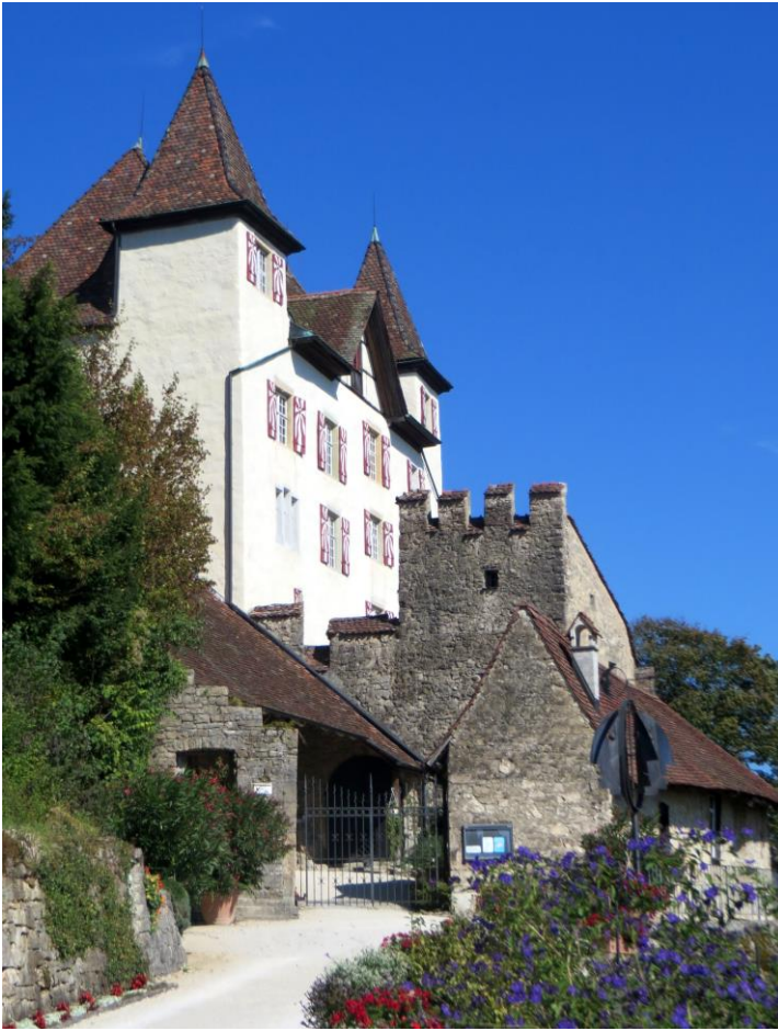
Schloss Wartenfels, Lostorf

Wechselnde Kunstaussstellungen, mit einem schönen französischen Garten.