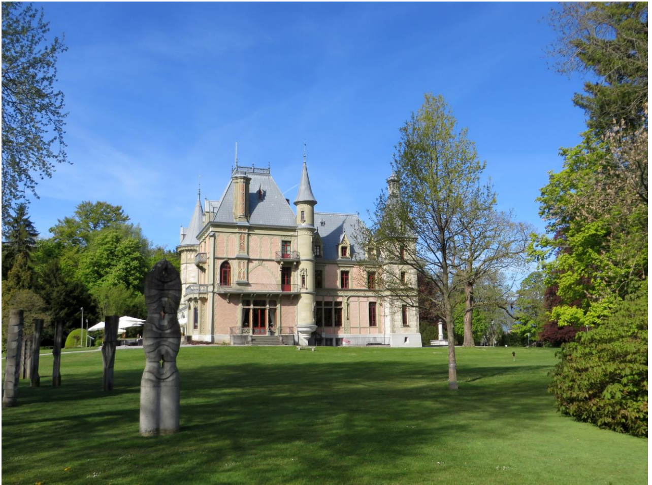
Schloss Schadau, Thun

Empfehlenswert ist der Sonntagsbrunch auf der Terrasse im Sommer.