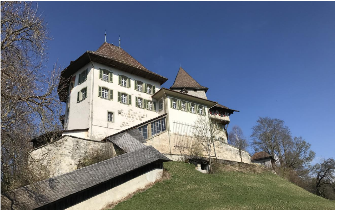
Schloss Trachselwald, BE

Mit düsterer Geschichte, da dort Mitglieder der Glaubensgemeinschaft der Täufer im Emmental verfolgt wurden.